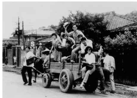
1952 大同中學高一時於青田街家中後院畫油畫→1957 與同學郊遊寫生