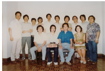
1982 十青版畫會員合影於台北

1975年赴香港中文大學講學。1976年獲中華民國版畫學會「金璽獎」。1977年應聘赴日本國立筑波大學新設立的版畫工作室創作並任教兩年半；1979~92年應聘返美國西東大學藝術系版畫教授。1979年獲吳三連文藝獎，將所得之獎金回饋給母校師大，作為鼓勵版畫創作的獎金。