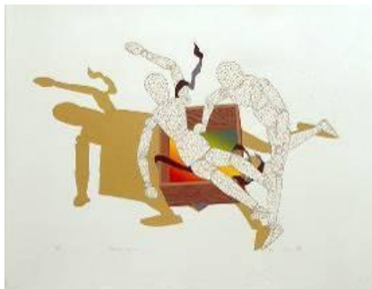
木頭人#85-5 Manikin #85-5