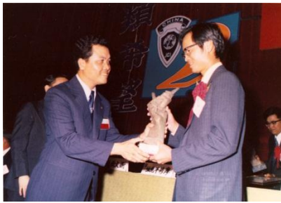
1974 榮獲中華民國十大傑出青年獎

1974年「版畫藝術」一書出版，成為學習版畫的經典。同年榮獲中華民國十大傑出青年獎及中山文藝獎(藝術創作類)，他仍持續於世界各地個展及聯展。子弟兵為慶賀老師得獎，成立台灣第一個版畫會「十青版畫」學會，希望能將版畫藝術有計畫的一代一代的傳承下去。